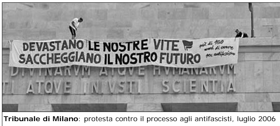
Tribunale di Milano: protesta contro il processo agli antifascisti, luglio 2006

Il punto più alto raggiunto dalla mobilitazione in solidarietà ai compagni e alle compagne arrestate è stato